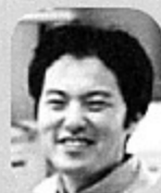
発行責任者 江口徹