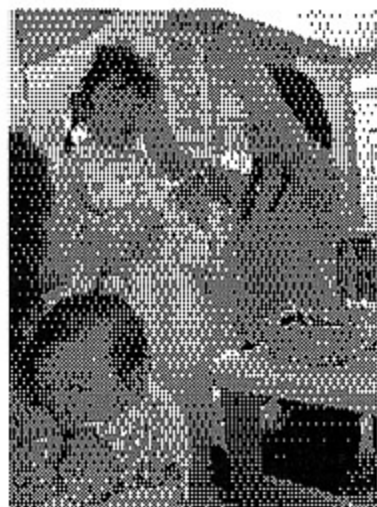
『ゆうゆう』での見学交流会にて。鯉田でも、ぜひ！！

公設公営の菰田保育所2Fの子育て支援センターと一味違う新しい民間主導の取り組み、こちらにも期待がかかります！