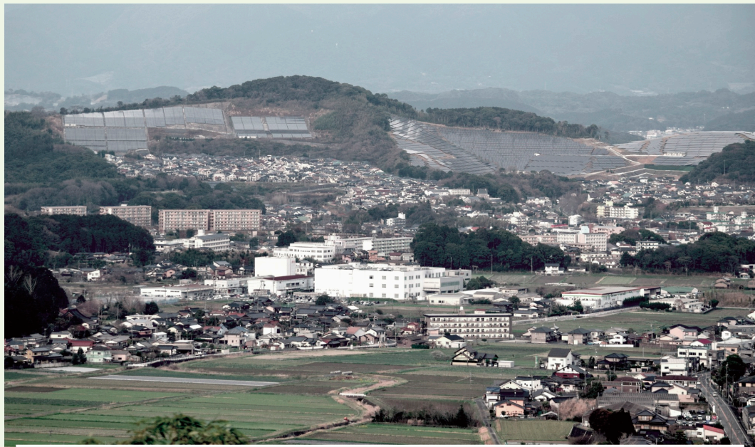
八木山展望台から見た白旗山メガソーラー 3月22日