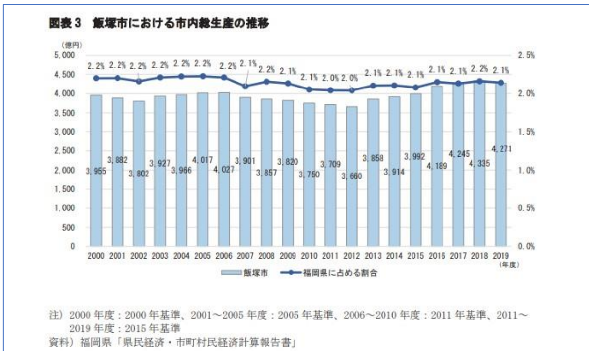
<図 6> 飯塚市における市内総生産の推移 飯塚市第 2 期産業振興ビジョン(2023-2027)より

一方、下記の図 6 のように、飯塚市の経済面では、人口の減少のように縮小が顕著な状況ではないと判断できる。この点は、直接議員定数に反映するものではないが、人口減少だけで、議員定数を議論するべきではないことの裏付けとなる。